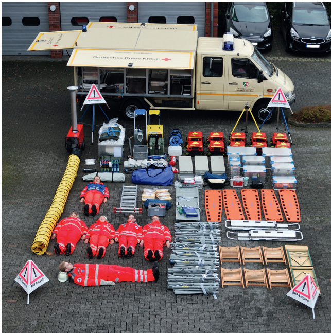
Gerätewagen Sanitätsdienst Ausstattung (inkl. Besatzung)

KATASTROPHENSCHUTZ NORDRHEIN-WESTFALEN #EngagiertFürNRW